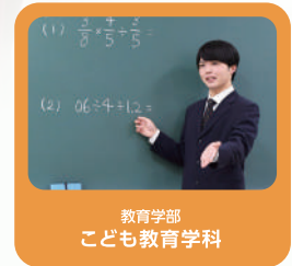
教育学部 こども教育学科