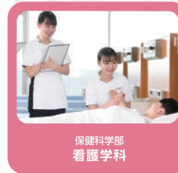
保健科学部 看護学科