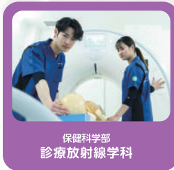
保健科学部 診療放射線学科