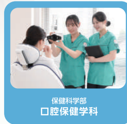
保健科学部 口腔保健学科