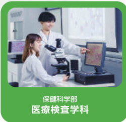
保健科学部 医療検査学科