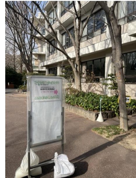
看護研究実践講座は神戸常盤大学4号館で開催