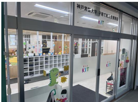
認知症高齢者看護実践講座は長田にある子育て総合支援施設「KIT」で開催