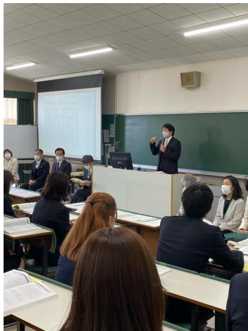
学科長先生や先生方の話に、熱心に耳を傾けて、大学生活がスタート！