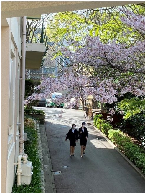
満開の桜の下 笑顔！笑顔！の新入生