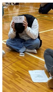
ソーシャルディスタンスを保ちつつ、心の距離は近くなったようです。