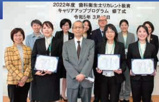
修了式 学長・学科長とともに

主に社会人に対して、1つの専門的な知識を体系的に学ぶ教育の機会を提供 する制度です。各コース履修修了者には、学校教育法に基づき「履修証明書」 を交付します。取得した履修証明は履歴書や名刺に記載することが出来ます。